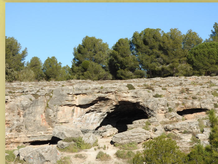
Cueva del Moro

La más conocida y famosa, se trata de un yacimiento en el que se han encontrado indicios de ocupación humana en la Prehistoria, probablemente de la Edad del Bronce. Está localizada en el Barranco del Moro, junto a otros abrigos y cuevas. Cuenta con dos entradas, en la principal se han encontrado algunos fragmentos amorfos que pudieron pertenecer a ajuares funerarios de la época.