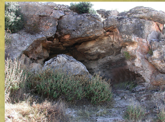
Cueva de la Paloma

Un sendero que se adentra a través del pinar para conectar dos lugares hasta ahora separados para el senderista y donde el pequeño esfuerzo que requiere la subida, tiene como recompensa un deleite para los sentidos