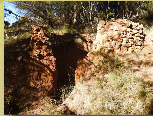
Calera-horno de cal