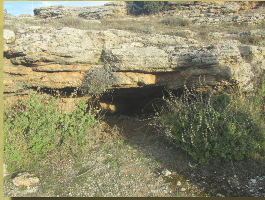
Cueva de la Higuerrilla

La Zubia se encuentra en una privilegiada localización y entorno, como puerta de entrada al Parque Natural de Sierra Nevada, muy cerca de Granada, rodeada de fértiles tierras. Es un municipio que guarda las huellas de los asentamientos, poblaciones y culturas que han pasado por estos lugares, con un rico patrimonio histórico-artístico. Además cuenta con áreas recreativas, bellos prados, cuevas y cerros que fomentan el turismo activo.