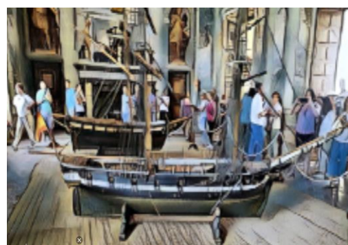
Archivo general de la Marina