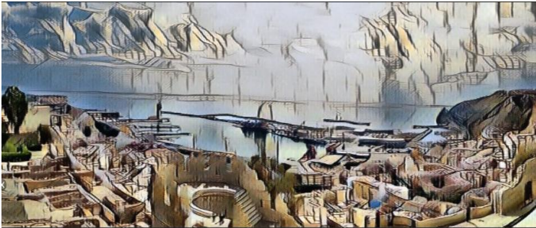
Almería, tierra de luz y de sol