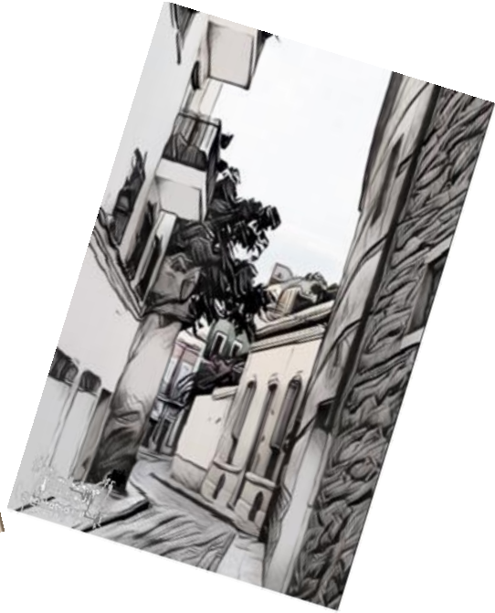
Calle en Almería