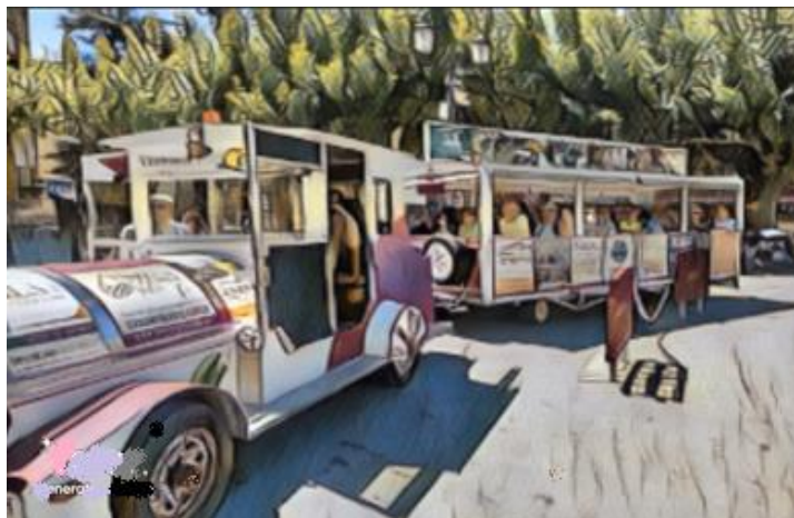
“Caballo de hierro”

- Ya con las baterías recargadas, dando un paseo triunfal a modo de despedida, por el centro de Cazorla, apareció un enorme caballo de hierro con un jinete a sus riendas y les invitó a subir a lomos de aquél ingenio y cabalgaron como el viento, por la pedanía de La Iruela, subieron por la ladera hasta la ermita de la Virgen de la Cabeza, patrona de Cazorla, y en aquél sitio, disfrutaron como chiquillos, del atardecer, tocando el cielo con Cazorla a sus pies. Fin